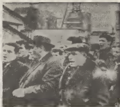
E dos graficonan aki riba ta demostra e numerosa welgata frances demostrando nan descontento pa cu e politica laborista di gobierno frances. Nan ta exigi un aumento di 11% y mentar cu e exigencia aki no wordo cumpli e welga lo continua y probablemente causando un crisis economico na Francia.